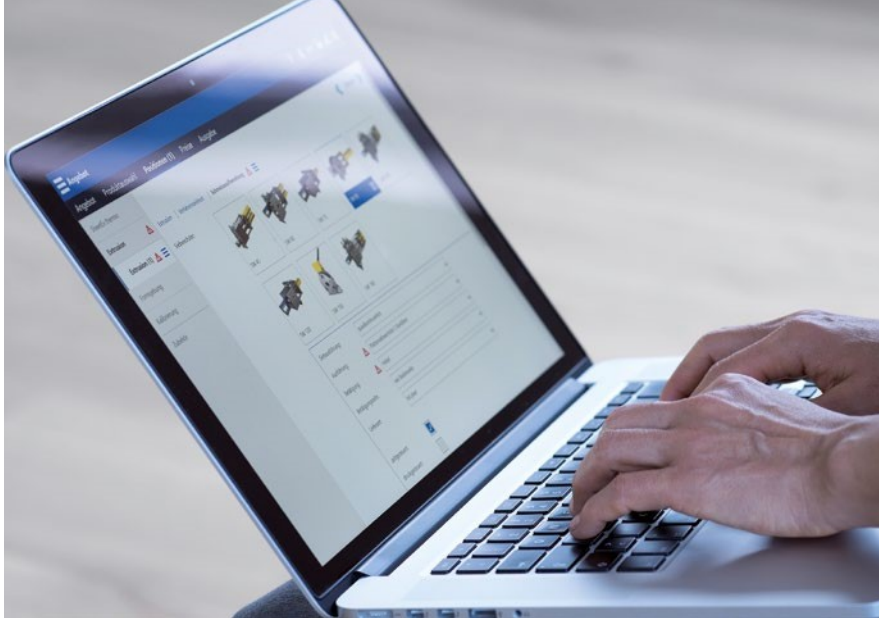
CPQ-Produktkonfigurator ist einfach zu bedienen.

Im Maschinen- und Anlagenbau stößt der Variantenmanagement-Ansatz hingegen an seine Grenzen, weil nicht alle Varianten in einem geschlossenen Baukasten im Vorfeld definiert werden können. Vom Standard abweichende Kundenwünsche, die im Engineering zu klären sind, müssen regelmäßig berücksichtigt werden. In diesem Zusammenhang sind auch die Workflowmechanismen des CPQ-Systems wichtig, um manuelle Positionen freizugeben, die nicht von den Stammdaten und dem Regelwerk des Produktmodells abgedeckt sind.